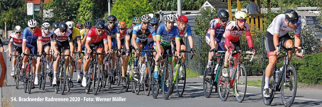
54. Brackweder Radrennen 2020