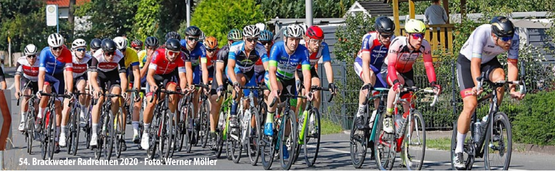
54. Brackweder Radrennen 2020